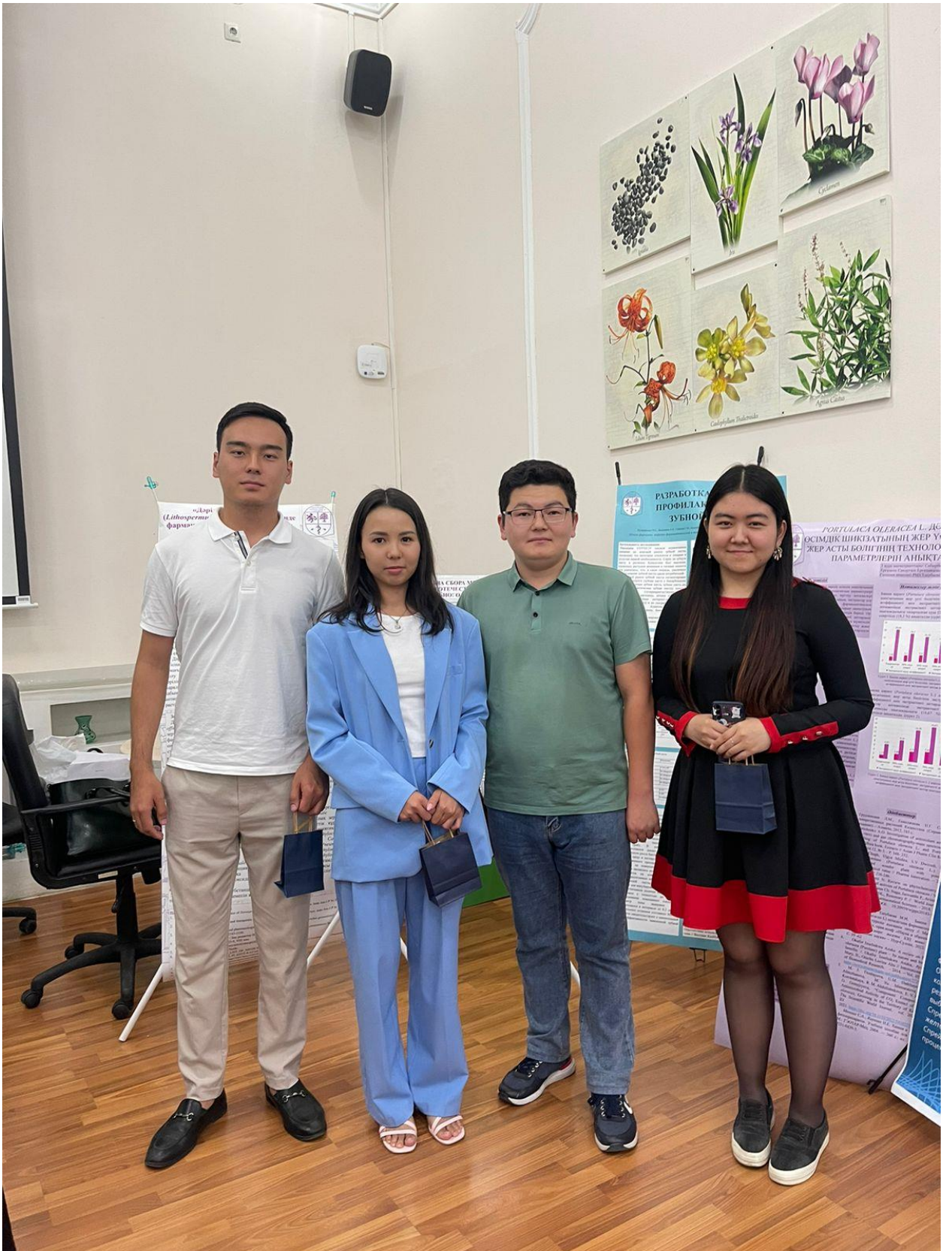
Победители по постерному секции