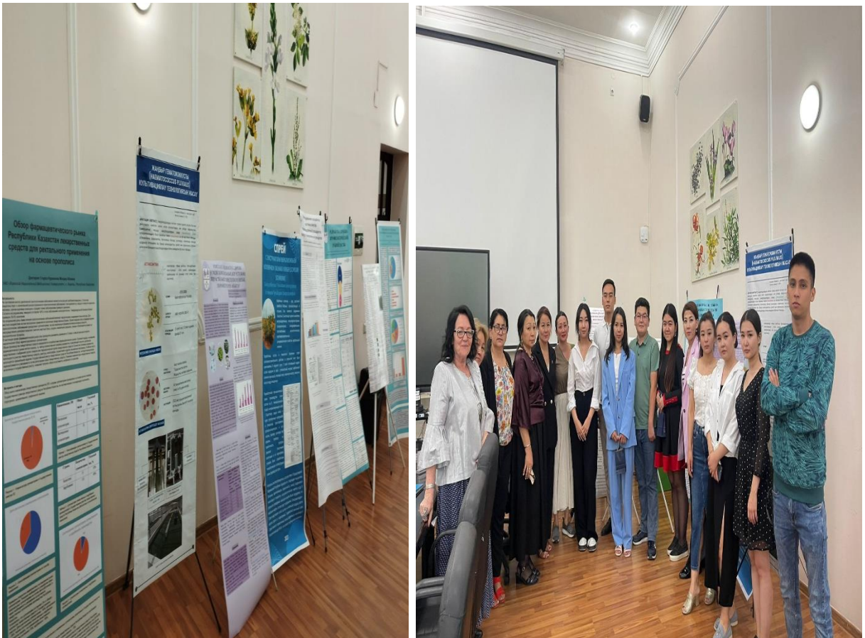
Участники по постерному секции