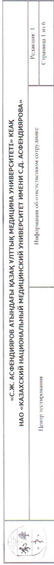
График консультации осенней сессии кафедры организации, управления и экономики фармации и клинической фармации на 2024-2025 учебный год